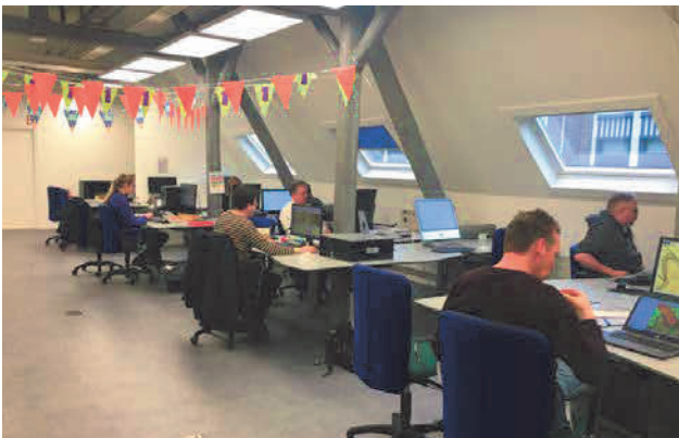
AEZEL-vrijwilligers aan het werk.