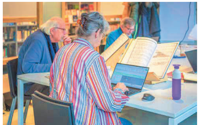
Vrijwilligers van Gouda Tijdmachine.

hand van verschillende aspecten na waarin deze initiatieven overeenkomen, waarin ze verschillen, waar ze staan en wat hun plannen zijn.